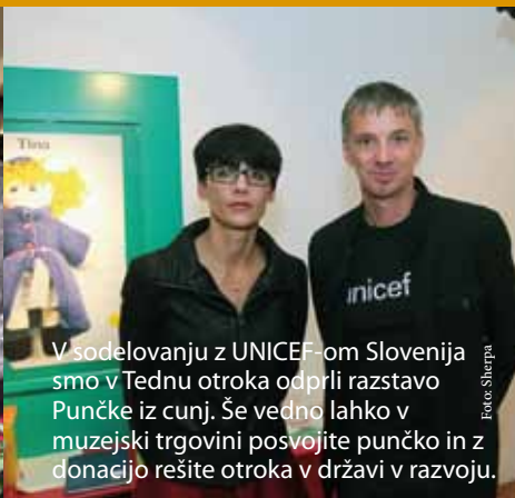
V sodelovanju z UNICEF-om Slovenija smo v Tednu otroka odprli razstavo Punčke iz cunj. Še vedno lahko v muzejski trgovini posvojite punčko in z donacijo rešite otroka v državi v razvoju.