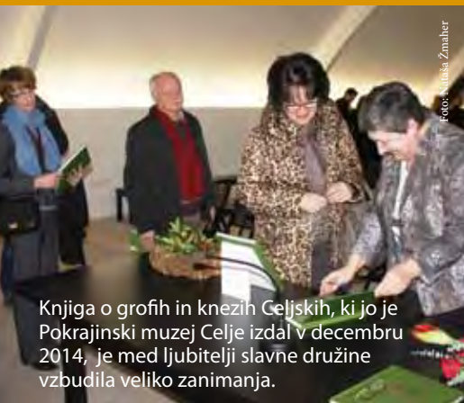
Knjiga o grofih in knezih Celjskih, ki jo je Pokrajinski muzej Celje izdal v decembru 2014, je med ljubitelji slavne družine vzbudila veliko zanimanja.