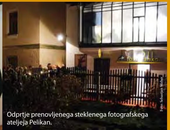
Odprtje prenovljenega steklenega fotografskega ateljeja Pelikan.