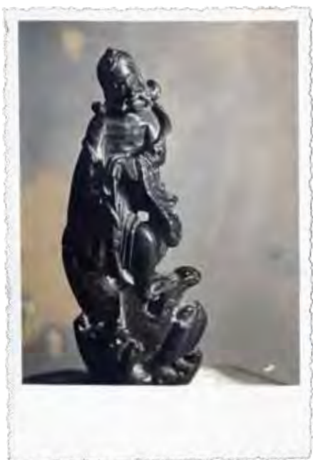
Skrivnostni Li Tieguai.

Dragoceni kitajski kipec iz zbirke Alme M. Karlin, ki ga hrani Pokrajinski muzej Celje, je do nedavnega veljal za pogrešanega. »Inkovski zaklad v podobi hudiča« je dobila v Peruju, na Kitajskem je izvedela, da kipec predstavlja daoističnega nesmrtnika Li Tieguaija, kasneje je postal junak mističnega romana Malik, po njeni smrti pa je skrivnostno izginil.