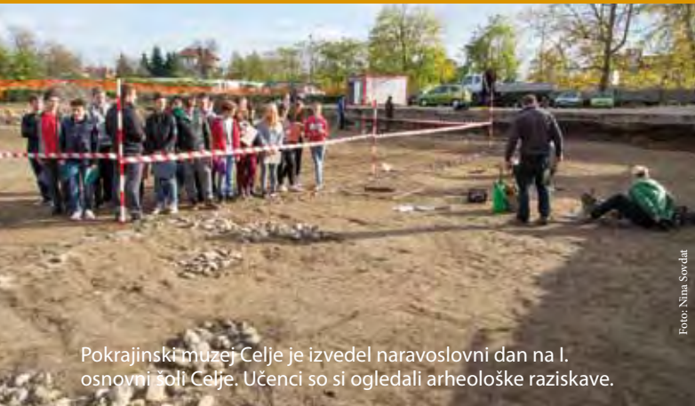
Pokrajinski muzej Celje je izvedel naravoslovni dan na I. osnovni šoli Celje. Učenci so si ogledali arheološke raziskave.