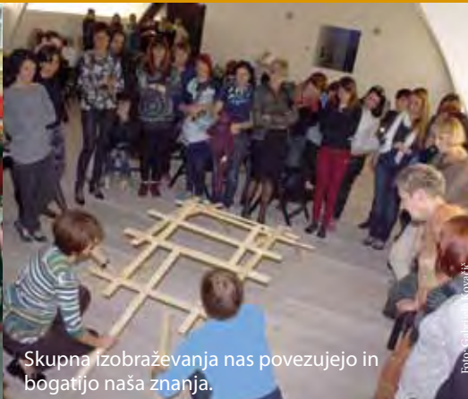
Skupna izobraževanja nas povezujejo in bogatijo naša znanja.