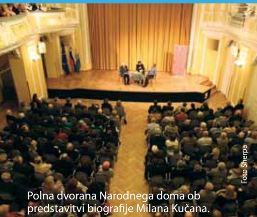
Polna dvorana Narodnega doma ob predstavitvi biografije Milana Kučana.