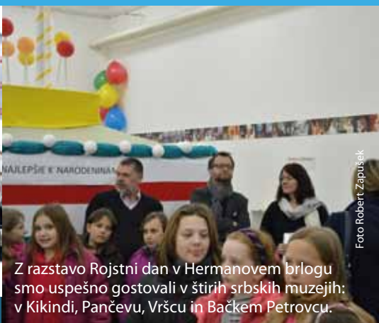
Z razstavo Rojstni dan v Hermanovem brlogu smo uspešno gostovali v štirih srbskih muzejih: v Kikindi, Pančevu, Vršču in Bačkem Petrovcu.