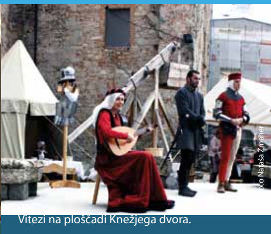
Vitezi na ploščadi Knežjega dvora.